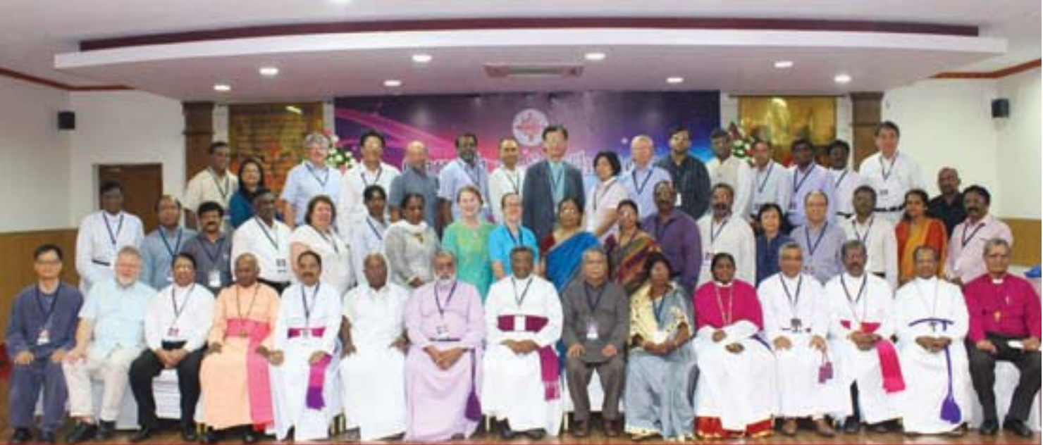
CSI Global partners meet Chennai Oct 2014