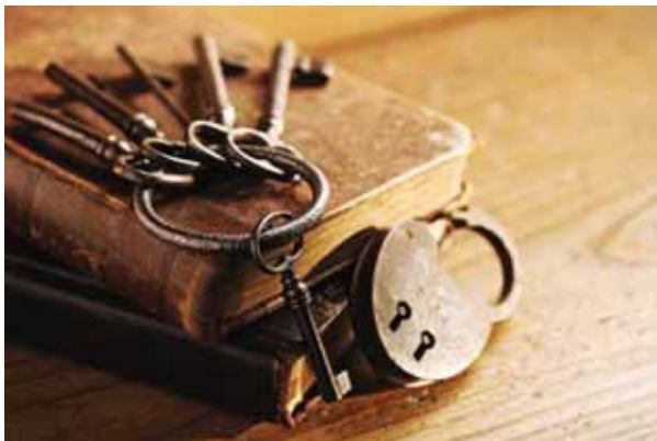
നൂറു വിഷൻ ഫോർ എ ചെയിഞ്ചിങ് വേൾഡ്

പുതിയനിയമത്തിൽ യേശു പ്രാർത്ഥനയെക്കുറിച്ച് പഠിപ്പിക്കുന്നതാണ്, സ്വാഭാവികമായും ആദ്യം നാം ശ്രദ്ധിക്കേണ്ടത്. ലൂക്കോസ് 11,18,20, മത്തായി 7,18 വായിക്കുമ്പോൾ നാം ഇത് പഠിക്കും. പൗലോസ്, യാക്കോബ്, യോഹന്നാൻ ഒക്കെ ഇത് പഠിപ്പിക്കുന്നു. എബ്രായലേഖനം പ്രാർത്ഥനയെക്കുറിച്ച് യുക്തിബദ്ധമായി വിവരിക്കുന്നു. സർവ്വോപരി കത്തുപ്രാർത്ഥന എന്ന് തെറ്റായി വിളിക്കപ്പെടുന്ന - മുടിയനായ പുത്രൻ എന്ന ശീർഷകം പോലെ - പ്രാർത്ഥന ഒരു സുഷ്മവിഭാഗം ഒഴികെ സകലക്രിസ്ത്യന്മാർക്കും ഉപയോഗിക്കുന്നത്. ശിഷ്യന്മാർ നിത്യവും ഉപയോഗിച്ചതായി രേഖയില്ലെങ്കിലും പ്രാർത്ഥന ദൈവവുമായി നടക്കുന്ന ഒരു മുഖാമുഖമാണ്. ദൈവവുമായുള്ള ഓരോ മുഖാമുഖവും ഒരു ന്യായവിധിയെ സൃഷ്ടിക്കുന്നു എന്ന് മെട്രോപ്പോളിറ്റൻ അന്തോണി (ആർച്ച് ബിഷപ്പ് ബ്ലൂം) പറഞ്ഞിട്ടുണ്ട്. നാമും ദൈവവും തമ്മിലുള്ള അകലം നമുക്ക് വ്യക്തമാകുന്ന വേളയാണ് ഓരോ പ്രാർത്ഥനാവേളയും. ദൈവത്തിന്റെ വിശുദ്ധിയും നമ്മുടെ അശുദ്ധിയും അല്ല സൂചിതം. ആ വിശുദ്ധിയോടുള്ള നമ്മുടെ പ്രതികരണമാണ് ആ ദൂരം നിർവചിക്കുന്നത്. പരീശന് നീതികരണം ഇല്ല. ചുങ്കക്കാരനാണ് ദൈവത്തോട് കൂടുതൽ അടുത്ത് നിൽക്കുന്നത്. മനസ്സാണ് പ്രധാനം. മനക്യതം, കൃതം, ന കായക്യതം.