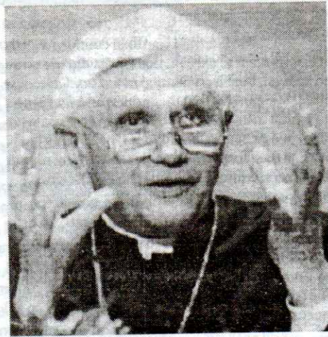
Cardinal Joseph Ratzinger

രണ്ട്, ഇതര സഭകളുമായുള്ള അമിത ബന്ധം കൊണ്ടാണ് തങ്ങളുടെ സഭയിൽ ഇപ്പോൾ പല പ്രശ്നങ്ങളും ഉടലെടുത്തതെന്നു വത്തിക്കാൻ സെക്രട്ടേറിയറ്റിലുള്ള അനേകർ ചിന്തിക്കുന്നു. അത് താഴേത്തട്ടിലേക്കു കൈമാറാനുള്ള അടവുകൂടിയാണ് ഈ രേഖ. കത്തോലിക്കാസഭയിൽ വൈദികരുടെ വിവാഹം അനുവദിച്ചുകിട്ടാൻ സമ്മർദ്ദമുറകുന്നു. യൂറോപ്യൻ രാജ്യങ്ങളിൽ സഭാധികാരികളെ കൂഴക്കുന്ന പ്രശ്നമാണിത്. സ്ത്രീകൾക്ക് പട്ടത്തം നല്കണമെന്ന ആവശ്യവും വർദ്ധിച്ചുവരുന്നു.