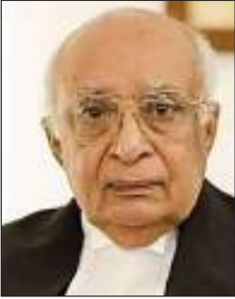
ജസ്റ്റിസ് കെ.ടി. തോമസ് സുപ്രീംകോടതി മുൻ ജഡ്ജി