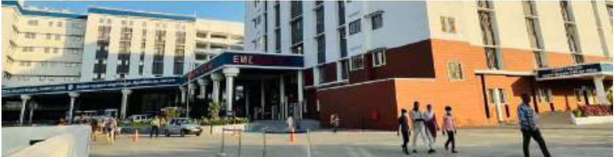
സി എം സി റാനിപെട്ട് ക്യാമ്പസ്

ടൈറ്റൻ യുവർ ബെൽറ്റ് ആൻഡ് ലൂക്കാഫ്റ്റർ വാ