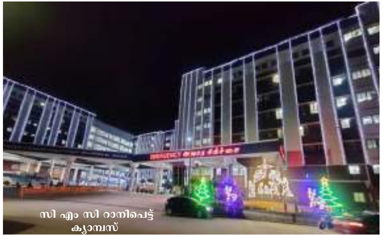
സി എം സി റാണിപെട്ട് ക്യാമ്പസ്